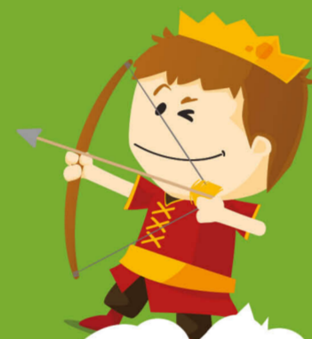
Château de Dampierre