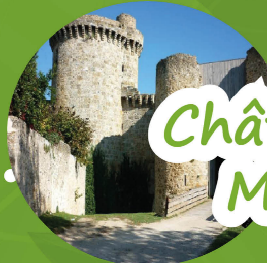
Château de la Madeleine