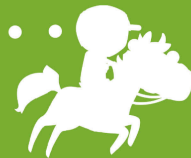
Haras des Bréviaires