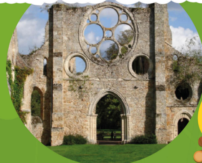
Vaux de Cernay